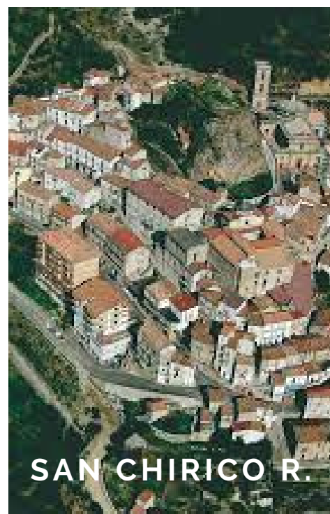
SAN CHIRICO R.